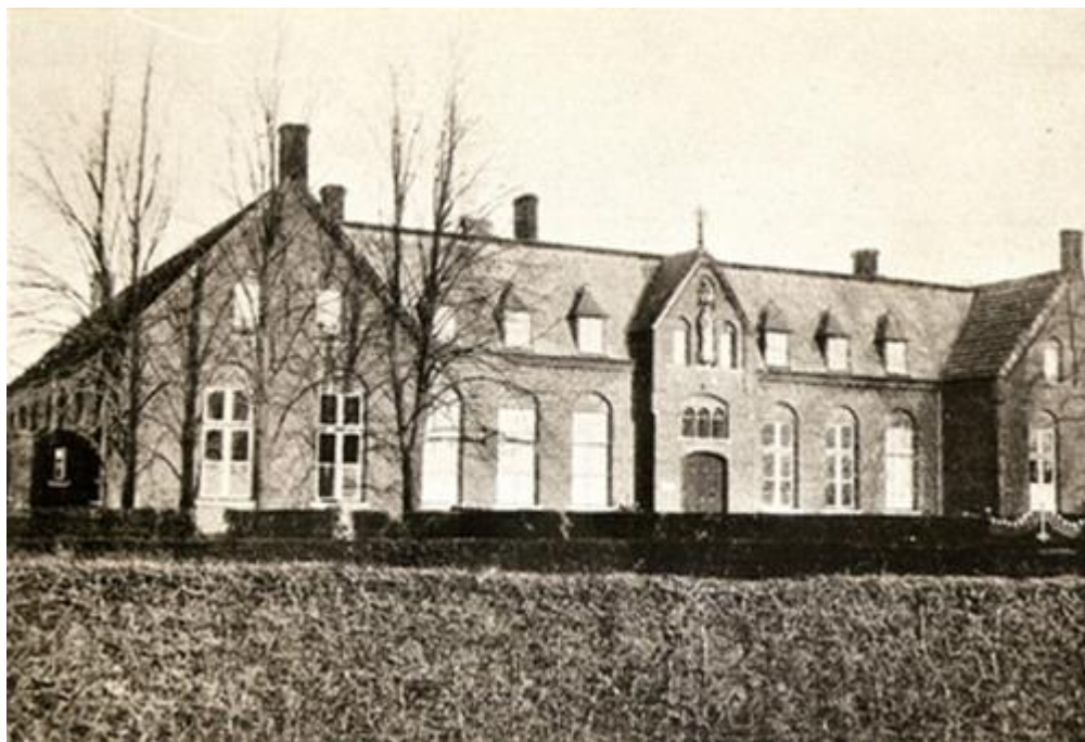
Het Liefdesgesticht St. Joseph in Haps anno 1905.

Korte geschiedenis van het Liefdesgesticht St. Joseph en de Zusters van Liefde in Haps.