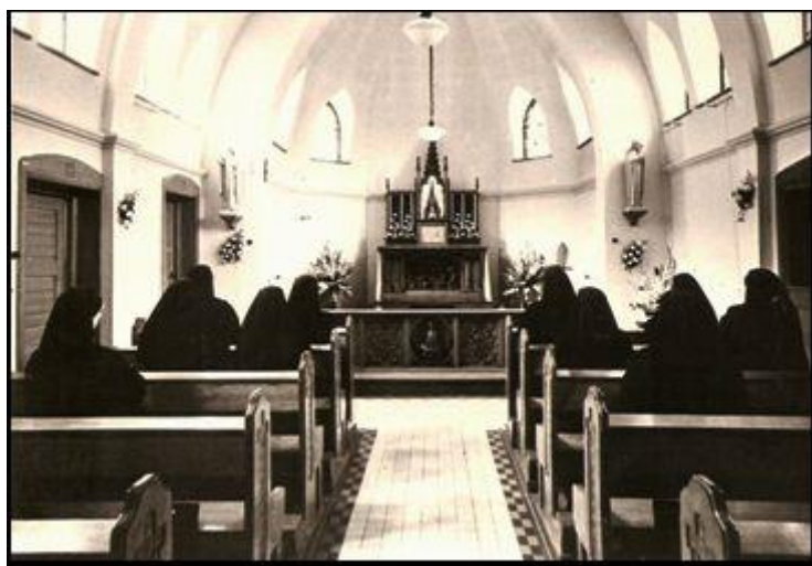
De kapel van het klooster.

In datzelfde jaar 1931 kon ook de nieuwe meisjesschool in gebruik worden genomen.