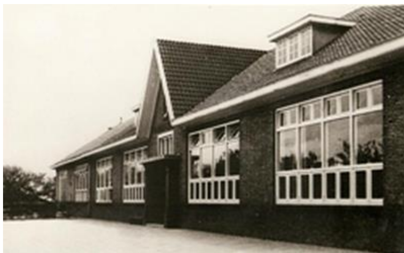
De nieuwe meisjesschool aan de Beerseweg.

In datzelfde jaar 1931 kon ook de nieuwe meisjesschool in gebruik worden genomen.