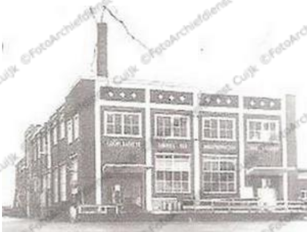
De melkfabriek in 1975 kort voor de sluiting

Zij wordt ondergebracht in de regionaal opererende "Maasvallei".