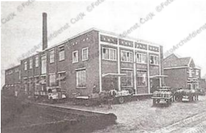
De zuivelfabriek na de oorlog in 1945. Met de directiewoning rechts. De platte karren van de melkophalers zijn hier goed te zien.

Waarschijnlijker is echter, de anti coöperatieve houding die in het Nederlandse bedrijfsleven heerste.