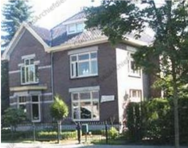
Alleen de directiewoning herinnert heden ten dage nog aan de melkfabriek.

De 34 meter hoge schoorsteen, die jaren een gezichtsbepalend beeld vormde voor het centrum van Cuijk, ging onder grote belangstelling eveneens tegen de vlakte.