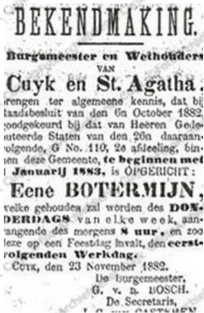
Bekendmaking van een door de gemeente opgerichte botermijn die op alle donderdagen zal worden gehouden.

De landbouwvereniging Cuijk richtte in 1892 een tweede botermijn op in het stationskoffiehuus.