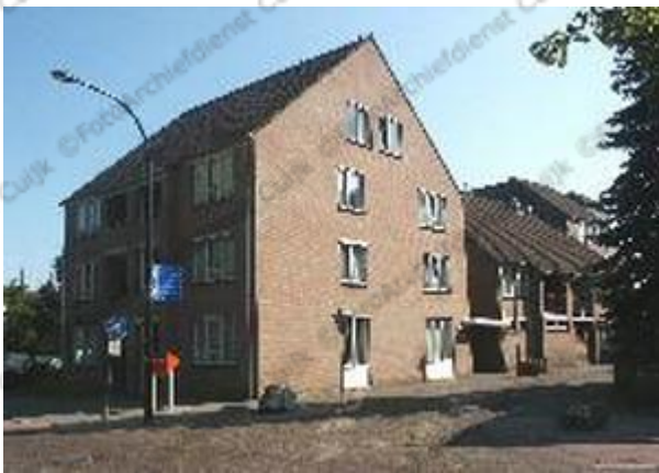
Op deze plaats stond tot medio jaren zeventig de melkproductenfabriek St. Maarten

Waar nu op deze plaats appartementen zijn gebouwd door Maasland, het Maasveld, stond vroeger de Coöperatieve stoomzuivelfabriek St. Maarten. De woning naast deze appartementen was de vroegere directiewoning van dit bedrijf.