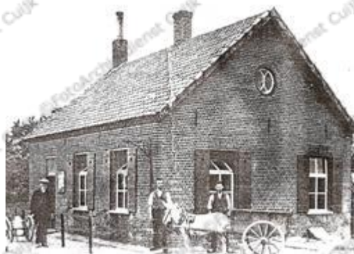
De Coöperatieve Stoomzuivelfabriek "St. Isidorus" te Linden was in bedrijf tot 1938.

Er waren toen ook al zogenaamde handkrachtfabriekjes: in Beers de 'Helpt Elkander' en in Linden 'St. Isidorus'.